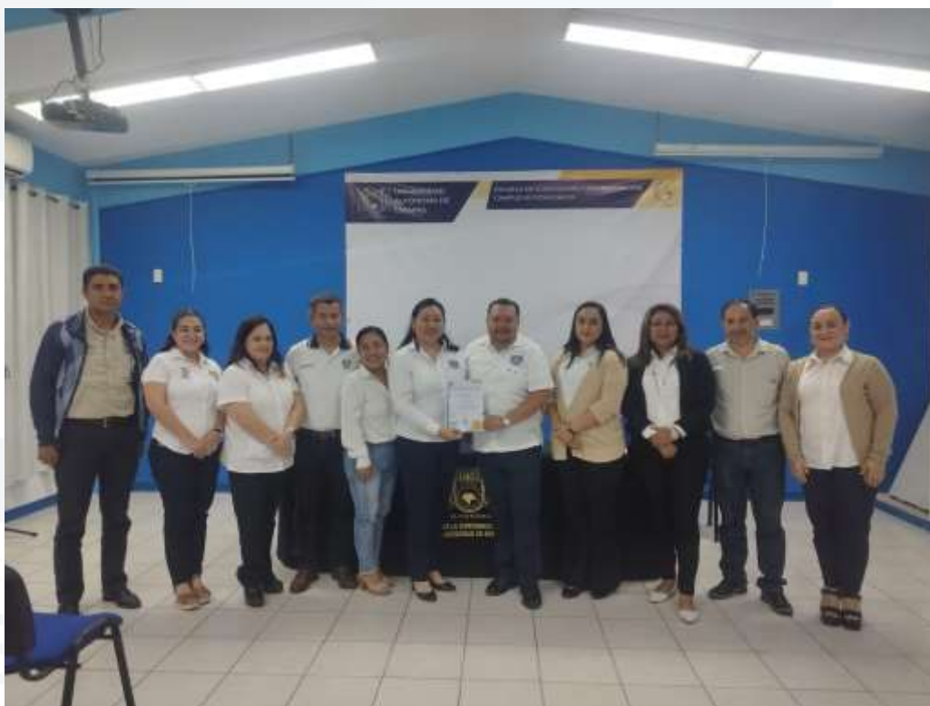
Ilustración 32.-Elección de representantes estudiantiles para el Consejo Técnico. Escuela de Contaduría y Administración, Campus VII Pichucalco.

Como parte fundamental de la estructura de gobierno de la Escuela de Contaduría y Administración, Campus VII Pichucalco, se llevó a cabo la integración del Consejo Técnico para el presente ciclo escolar. Este órgano colegiado, conformado por 11 integrantes entre docentes y estudiantes representantes de las licenciaturas en Contaduría y Administración, queda formalmente constituido