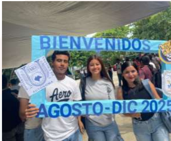
Ilustración 1.- Estudiantes de nuevo ingreso de las Licenciaturas en Contaduría y Administración

La Unidad Académica ofrece actualmente cuatro programas educativos: Licenciatura en Contaduría, Licenciatura en Administración, Licenciatura en Agronegocios y Licenciatura en Gestión Turística. Estas dos últimas se