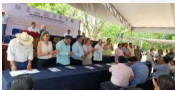
Ilustración 23.- firmaron convenios de colaboración con Presidentes Municipales de 11 municipios de la región VIII de la zona norte de Chiapas.

Durante el presente año 2025, se ha demostrado un dinamismo significativo en la gestión de vinculación, suscribiéndose 11 nuevos convenios generales y 16 acuerdos de colaboración que representan una ampliación considerable de las oportunidades para la comunidad estudiantil.