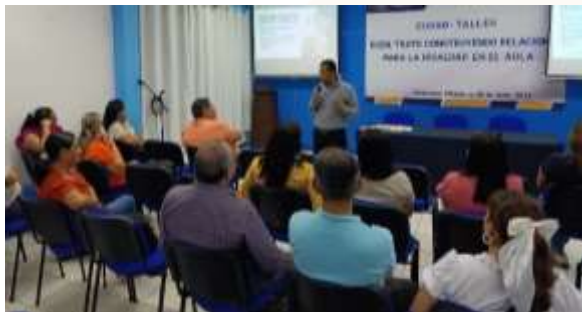
Ilustración 16.- Taller buen trato: "construyendo relaciones para la igualdad en el aula" (05/06/2025).

Durante el ciclo escolar Enero-Julio 2025, se llevaron a cabo 2 actividades