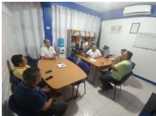
Ilustración 34.- reunión de trabajo con integrantes de la Academia de Investigación, con el objetivo de coordinar esfuerzos para el desarrollo de nuevos proyectos académicos.

Asimismo, estas estructuras de trabajo conjunto impulsan proyectos de investigación que fomentan la participación activa y corresponsable de docentes, estudiantes y actores clave de la comunidad, contribuyendo significativamente a la generación y aplicación del conocimiento, así como al fortalecimiento de la vinculación