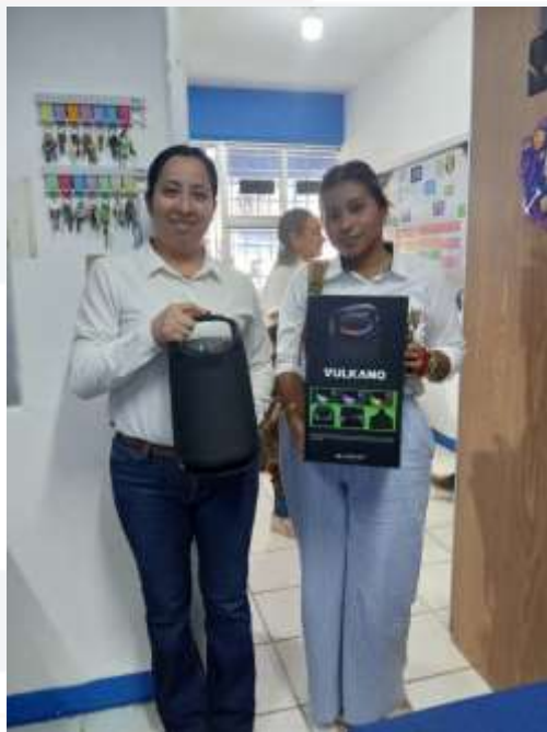
Ilustración 36.- bocinas marcan Vulkano altavoz karaoke de 2.1 canales y 80w RMS con luces RGB ambientales.

En el periodo actual, se realizó la adquisición de equipos tecnológicos para mejorar los recursos disponibles para la comunidad universitaria que incluyen: