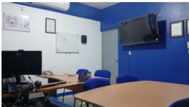
Ilustración 35.- pantalla Smart TV de 54 pulgadas (modelo TCL55QG51GQ), instalada en la Dirección de la Escuela.

En este año se obtuvo la dotación de 15 sillas para zurdos, mobiliario que permitió atender las necesidades específicas de los estudiantes y mejorar la