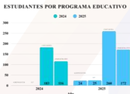
Ilustración 3.- Gráfica de la población estudiantil.

La Unidad Académica cuenta, para el periodo 2024–2025, con una matrícula total de 481 estudiantes, distribuidos en los diferentes programas educativos que ofrece. De esta cifra, 260 estudiantes pertenecen a la Licenciatura en Contaduría (140 mujeres y 120 hombres); 172 estudiantes a la Licenciatura en Administración (109 mujeres y 63 hombres); 24 estudiantes a la Licenciatura en Agronegocios (17 mujeres y 7 hombres); y 25 estudiantes a la Licenciatura en Gestión Turística (13 mujeres y 12 hombres).