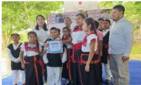
Ilustración 25.- Foro del Día Internacional de la Lengua Materna.

El presente documento consolida la planeación y reporte de una amplia gama de actividades realizadas y por realizar en la Escuela de Contaduría y Administración, Campus VII Pichucalco, durante el periodo noviembre 2024 a