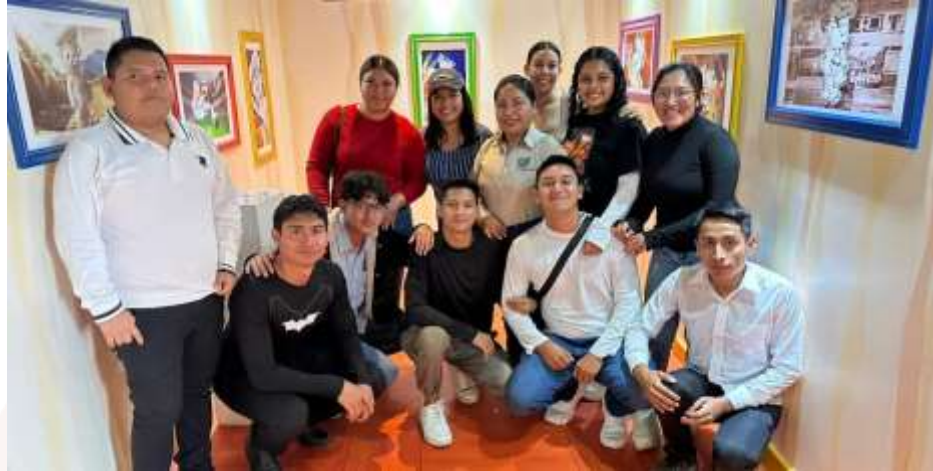
Ilustración 26.- Viaje de estudios a la Empresa BIMBO, Villahermosa, Tabasco. 27 de octubre de 2025.

en el aula mediante la experiencia práctica en entornos empresariales y financieros reales.