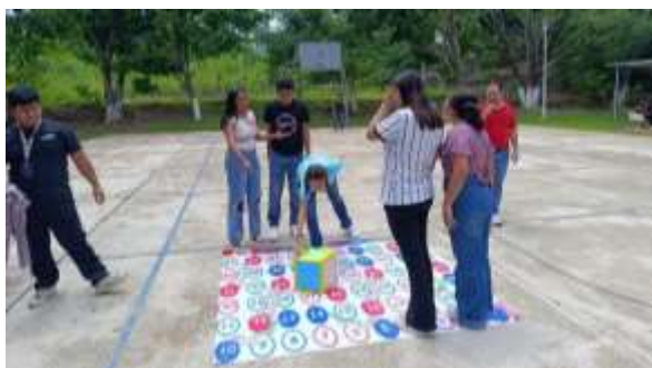
Ilustración 15.- Jornada Institucional de Tutorías 2025 (29/04/2025).

El programa de tutorías del ciclo Enero-Julio 2025 demostró un sólido compromiso con la comunidad estudiantil y docente. A través de 4 actividades estratégicas, se logró un impacto directo en 1,100