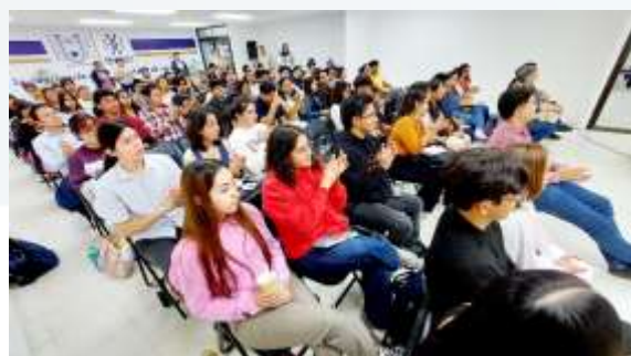
Ilustración 9.- Taller de Movilidad Estudiantil, organizado por la Coordinación General de Relaciones Interinstitucionales.

estudiantil en la próxima convocatoria de movilidad enero-junio 2026. Como resultado, se registraron dos postulaciones a la Universidad Autónoma de Baja California, reafirmando el interés y compromiso del alumnado con su desarrollo académico internacional.