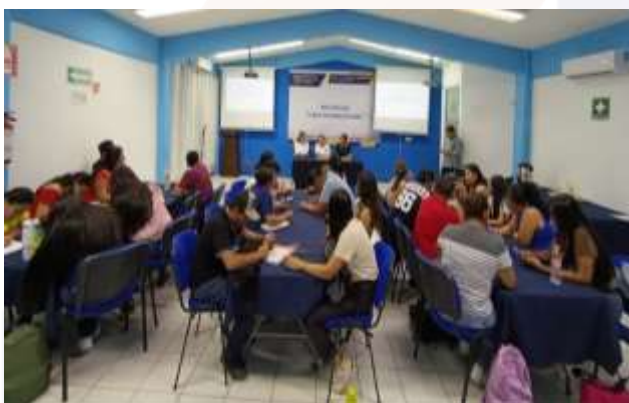
Ilustración 11.- Diplomado: "Clima Organizacional" (27 de octubre al 02 de diciembre de 2026) - 25 personas.