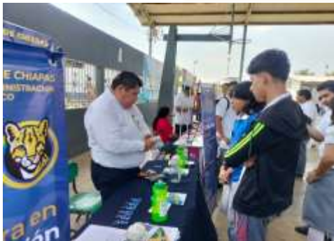
Ilustración 24.-Feria Profesiográfica 2025, organizada por el COBATAB Plantel No. 11, en el municipio de Jalapa, Tabasco.

Como parte fundamental de las estrategias de promoción y vinculación, la Escuela de Contaduría y Administración, Campus VII, ha llevado a cabo un programa intensivo de participación en Ferias Profesiográficas durante el periodo octubre 2024-septiembre 2025. Estas actividades tienen como objetivo principal difundir la oferta educativa de las licenciaturas en Contaduría y Administración entre los estudiantes de nivel medio superior, captar prospectos de calidad y fortalecer la presencia institucional en la región.