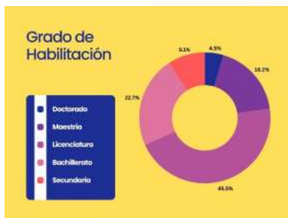
Ilustración 30.- Gráfica de personal administrativo por Grado de Habilidadación.

Al comparar la composición académica del personal administrativo entre los ciclos 2023-2024 y 2024-2025, se identifica una completa estabilidad en el perfil de formación. La distribución del personal se mantuvo sin variación