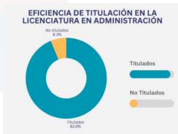
Ilustración 7.- Eficiencia de titulación en la Licenciatura en Administración, durante el periodo 2024-2025.

En términos porcentuales, se alcanzó una eficiencia de titulación del 73.32% en la Licenciatura en Contaduría y del 93.75% en la Licenciatura en Administración, lo que evidencia el esfuerzo conjunto de docentes,