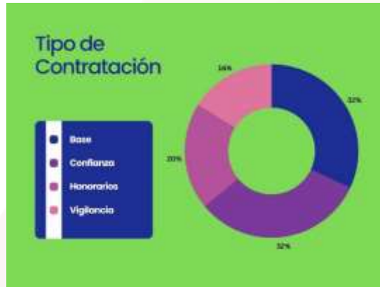
Ilustración 29.- Gráfica de personal administrativo por Tipo de Contratación.

La estructura del personal administrativo de la Unidad Académica se encuentra conformada por un total de 25 trabajadores, distribuidos bajo las siguientes condiciones de contratación: