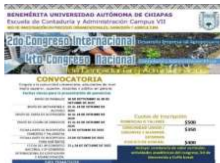
Ilustración 21.- “Segundo Congreso Internacional Desarrollo Empresarial Agropecuario 4º Congreso Nacional Contaduría y Administración Eficaz” los días

El Grupo Colegiado de investigación denominado “Procesos Organizacionales Contable y Administrativos” organizaron el “Segundo Congreso Internacional Desarrollo Empresarial Agropecuario y el 4º Congreso Nacional Contaduría y Administración Eficaz” los días 23 y 24 de octubre del presente año.