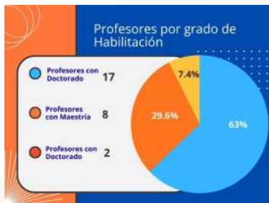
Ilustración 13.- Gráfica en porcentaje, profesores por grado de habilitación.

En cuanto al grado de habilitación, la escuela se distingue por un alto nivel