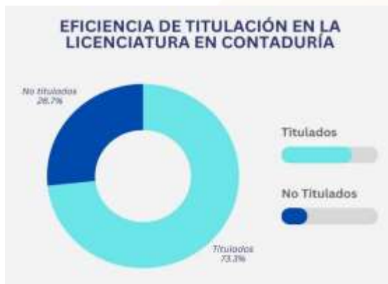
Ilustración 6.- Eficiencia de titulación en la Licenciatura en Contaduría, durante el periodo 2024-2025.

Estos resultados reflejan el cumplimiento de los objetivos institucionales