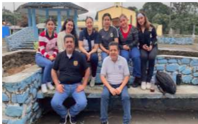
Ilustración 22.- UVD: El Papel de las Asesorías Contables en las Mipymes de la Localidad de Tectiapán del Municipio de Pichucalco, Chiapas

La Escuela de Contaduría y Administración ha fortalecido la vinculación social mediante la implementación de Unidades de Vinculación Docente (UVD), orientadas a impulsar el aprendizaje práctico, la responsabilidad social y la intervención académica en beneficio de los sectores productivos y educativos de la región.