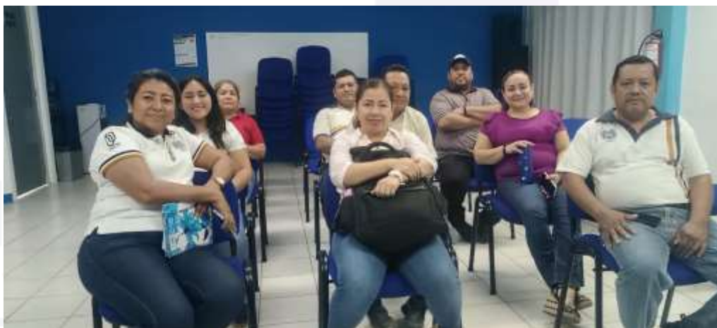
Ilustración 33.- Reunión Unidad Interna de Protección Civil.