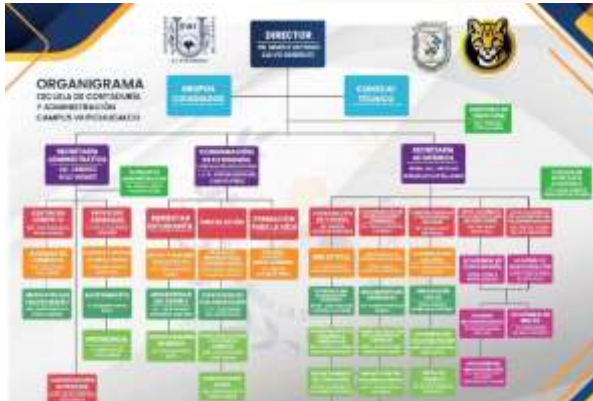
Ilustración 28.- Organigrama Campus VII Pichualco (Estructura Organizacional).

La estructura organizacional de la Escuela de Contaduría y Administración, Campus VII Pichualco, se sustenta en un modelo departamental especializado, concebido para respaldar de manera integral las funciones sustantivas de la institución. Esta configuración garantiza el fortalecimiento de las actividades académicas y administrativas, así como la proyección social y la extensión-vinculación con los distintos sectores de la sociedad.