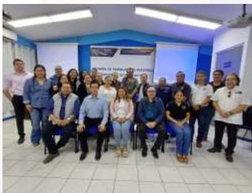
Ilustración 18.- Reunión de trabajo con personal docente, DGIP y DFIE.

La investigación es una de las funciones sustantivas de la Benemérita Universidad Autónoma de Chiapas (UNACH), y con el firme