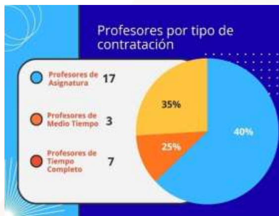
Ilustración 12.- Gráfica en porcentaje, profesores por tipo de contratación.

La Escuela de Contaduría y Administración, Campus VII Pichucalco, cuenta con una planta docente conformada por 27 académicos comprometidos con la formación integral de los estudiantes. De este total, 7 docentes laboran con nombramiento de tiempo