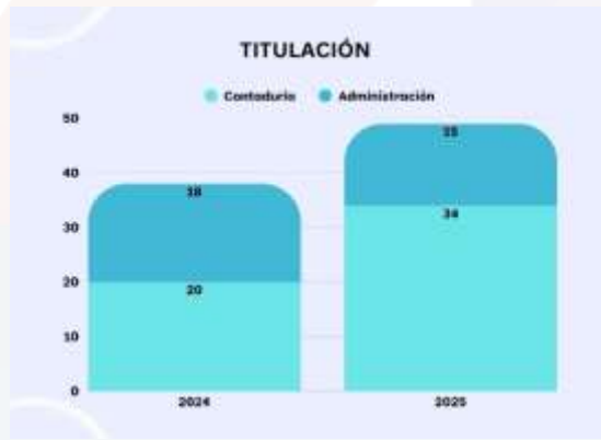
Ilustración 5.- Gráfica de número de egresados titulados en el periodo 2024-2025.

Para el ciclo noviembre 2024 – septiembre 2025, se ha registrado la titulación de 45 egresados, distribuidos de la siguiente manera: