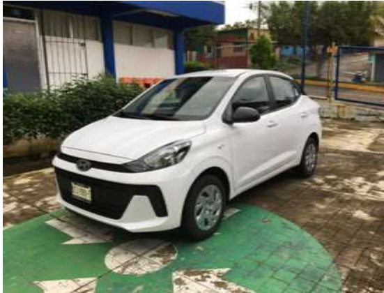
Ilustración 37.- Vehículo: Hyundai Grand I10

Durante el ejercicio 2025 no se han adquirido nuevos equipos de transporte, por lo tanto, se cuenta con el siguiente parque vehicular: