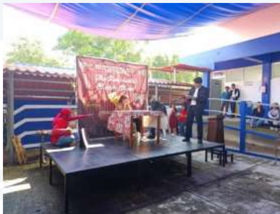
Ilustración 27.- Evento "The Fun-tastic Sketch Show!" en la explanada de la Plaza Cívica de la Escuela.

Actualmente la Unidad Académica imparte 4 niveles de inglés curriculares y 2 niveles extracurriculares (requisito) que ayudan a mejorar la comprensión de este idioma a los estudiantes con la finalidad de fortalecer las competencias lingüísticas y