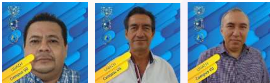
Ilustración 17.- El Comité de Investigación y Posgrado.