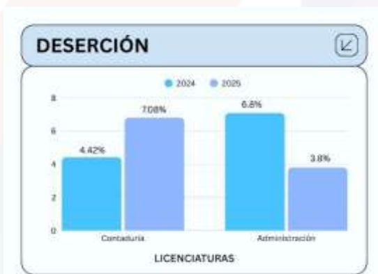
Ilustración 4.- Gráfica de la deserción estudiantil.

Durante el ciclo escolar enero–diciembre 2024, la tasa de deserción registrada fue del 4.42% en la Licenciatura en Contaduría y del 7.08% en la Licenciatura en Administración.