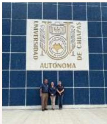
Ilustración 19.-Proyectos de investigación: “Alfabetización y educación financiera en la toma de

Para el ciclo 2024–2025, se llevó a cabo el registro de tres proyectos de investigación ante la Dirección General de Investigación y Posgrado (DGIP) durante el mes de agosto.