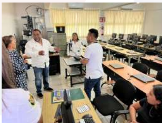
Ilustración 2.- Centro de Cómputo durante el recorrido de los CIEES.

En enero de 2020, la Licenciatura en Contaduría obtuvo el reconocimiento por su excelencia académica,