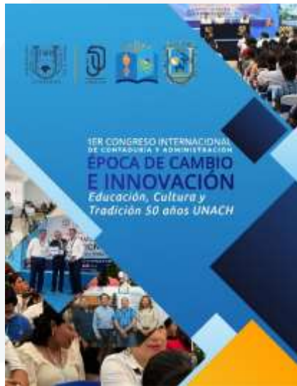
Ilustración 20.- libro de la memoria de los artículos emanados del Primer Congreso Internacional de Contaduría y Administración, Época de Cambio e Innovación. Educación, Cultura y Tradición 50 años UNACH.

Durante mi gestión, he impulsado una política activa de fomento a la investigación, productividad académica y difusión del conocimiento, promoviendo la participación docente y estudiantil en espacios de creación e intercambio científico.