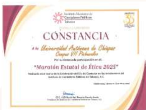
Ilustración 14.- Constancia por Participación en el "Maratón Estatal de Ética 2025"

Durante el periodo 2024-2025, la Escuela de Contaduría y Administración del Campus VII Pichualco ha demostrado un desempeño sobresaliente y