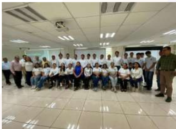
Ilustración 10.- Maratón Estatal de Ética 2025, evento presencial celebrado en el Instituto de Contadores Públicos de Tabasco.

En cumplimiento con los objetivos del plan de trabajo y en el marco de la formación integral de los estudiantes, la Escuela de Contaduría y