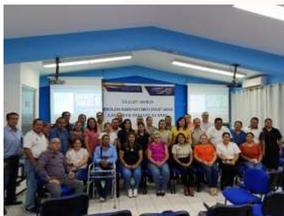
Ilustración 31.- taller titulado “Buen Trato: Construyendo relaciones para la igualdad en el aula”.

En este periodo se llevaron a cabo nueve acciones formativas entre cursos, talleres y diplomados, enfocados en temas de igualdad de